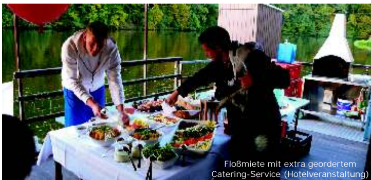
Floßmiete mit extra geordertem Catering-Service (Hotelveranstaltung)

Hinweis: Bei Nutzung von zwei Flößen parallel für maximal 70 Teilnehmer an Bord (Doppelfloß) verdoppeln sich auch die Mietpreise.