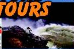
Wander-, Rad-, Kanutouren