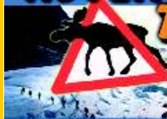
Skilanglauf- & Huskytouren