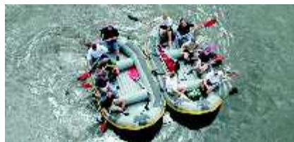
Schlauchboot "Hippo" für je 8 -12 Personen